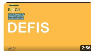
Parcours entreprises Ev@gill ANLCI - Film Défis