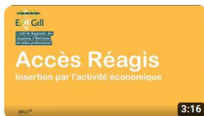
Parcours entreprises Ev@gill ANLCI - Film Accès Réagis

Ce document fournit des chiffres, des repères, des présentations d'outils et ressources, pour accompagner et amplifier la mobilisation portée depuis des années sous l'impulsion de l'ANLCI par les partenaires sociaux et les branches professionnelles, pour faire reculer l'illettrisme dans le monde du travail.