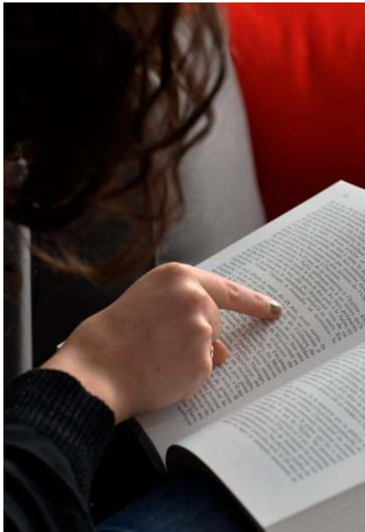
Les personnes qui éprouvent des difficultés à lire souffrent souvent d'isolement.