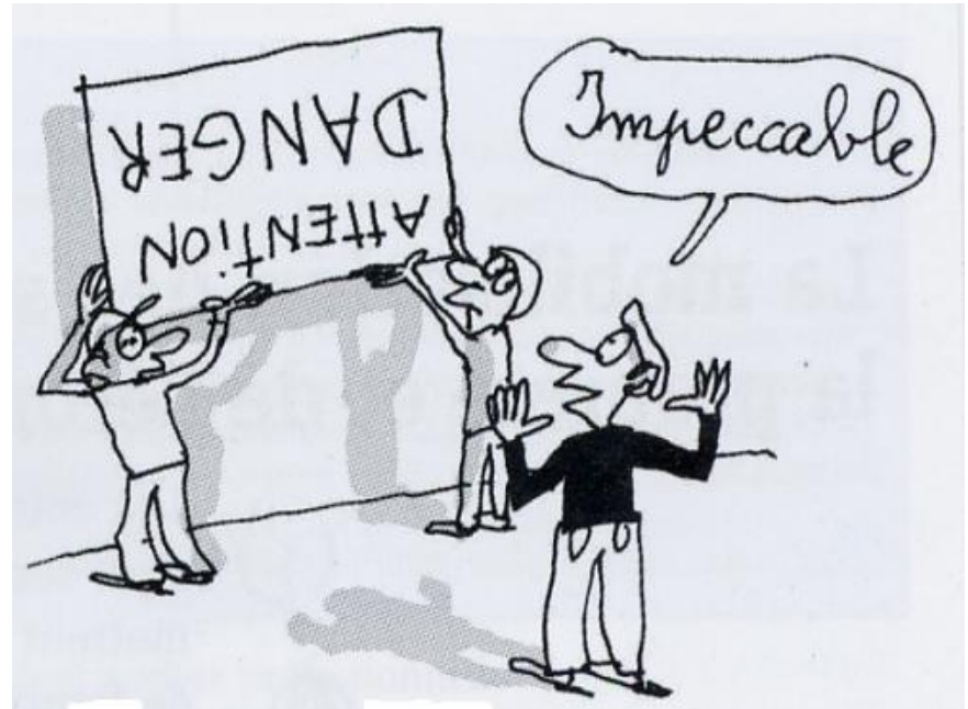
Dessin de Jacques Azam pour les éditions Milan « L'illettrisme, mieux comprendre pour mieux agir »

6 % de ceux qui sont dans l'emploi (8 % en 2004) et 10 % des demandeurs d'emploi (15 % en 2004) sont confrontés à l'illettrisme.